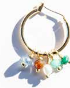
Créoles XS laiton doré perles verre multicolores Inde 15,90 € (69180)