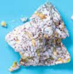
Crackers de riz rouge BIO Thaïlande 50 g 1,65 €