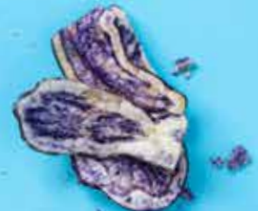
Chips de pommes de terre bleues BIO Pérou 100 g 3,85 €