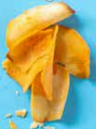
Chips de Yuca au paprika Costa Rica 50 g 1,40 € 150 g 4,10 €