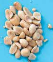
Cacahuètes BIO Chine 150 g 2,40 €