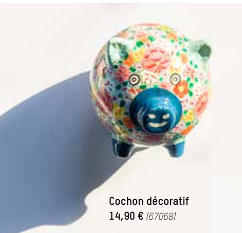
Cochon décoratif 14,90 € (67068)