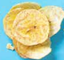
Chips de banane au sel Costa Rica 85 g 1,95 €