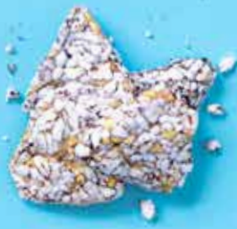
Crackers de riz noir BIO Thaïlande 50 g 1,65 €