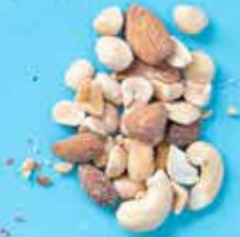
Mélange de noix grillées et salées BIO Burkina Faso et Pakistan 100 g 3,70 €