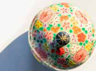
Boite à bijoux 7,90 € (67070)