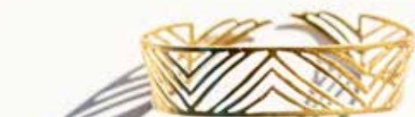
Bracelet réglable laiton doré ajouré triangles Népal 21,50 € (69152)