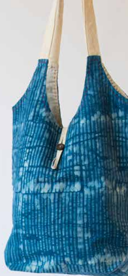
Sac à main en coton, imprimé batik wax bleu Bangladesh 24,90 € (69123)

Une écharpe soyeuse, un sac en jute dans les tons bleus, quelques céramiques et nous voilà transporté.e.s sur des plages sublimes. Le secret de ce tour de passe-passe ? Le commerce équitable, bien sûr !