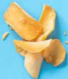
Chips de Yuca au taco Costa Rica 50 g 1,40 € 150 g 4,10 €

La coopérative costaricienne Coopesarapiquí regroupe quelque 170 familles agricoles et est intégralement gérée par des femmes. La coopérative cultive du café, du manioc ou « Yuca », des bananes et des ananas. Oxfam paie un prix équitable aux agricultrices et leur verse une prime du commerce équitable. Depuis 2022, en partie grâce au soutien d'Oxfam, la coopérative s'est même vue attribuer le label officiel de l'organisme d'audit indépendant FLOCERT, qui reconnaît Coopesarapiquí comme une coopérative de commerce équitable.