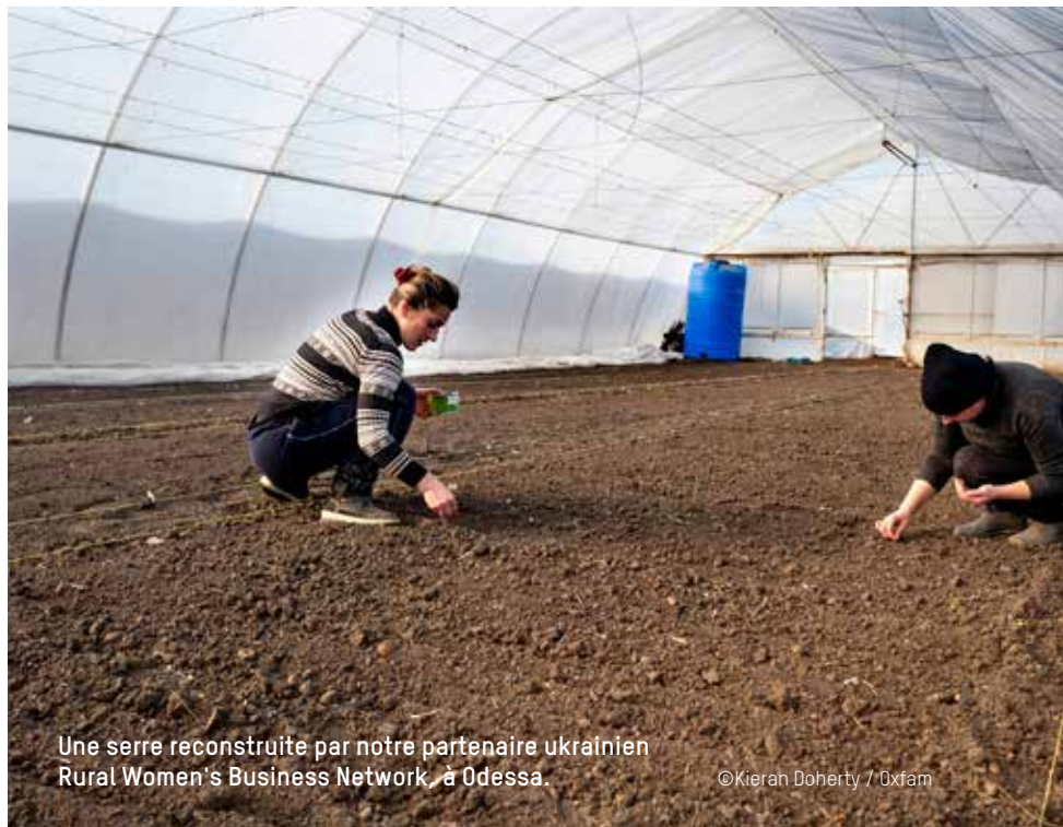
Une serre reconstruite par notre partenaire ukrainien Rural Women's Business Network, à Odessa.

Dès les premières semaines, nos équipes se sont déployées en Pologne, en Roumanie et en Moldavie où