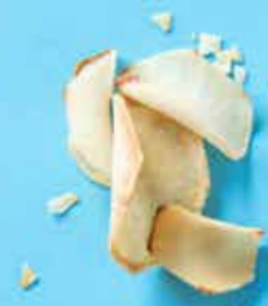
Chips de Yuca au sel Costa Rica 50 g 1,40 € 150 g 4,10 €

Il faut quand même se l'avouer, l'apéro c'est le meilleur moment de la soirée. Alors au placard les traditionnels cornichons et chips paprika vus et revus et surprenez vos invité.e.s avec une poignée de noix de cajou, des chips yuca bleus et des crackers au riz noir.