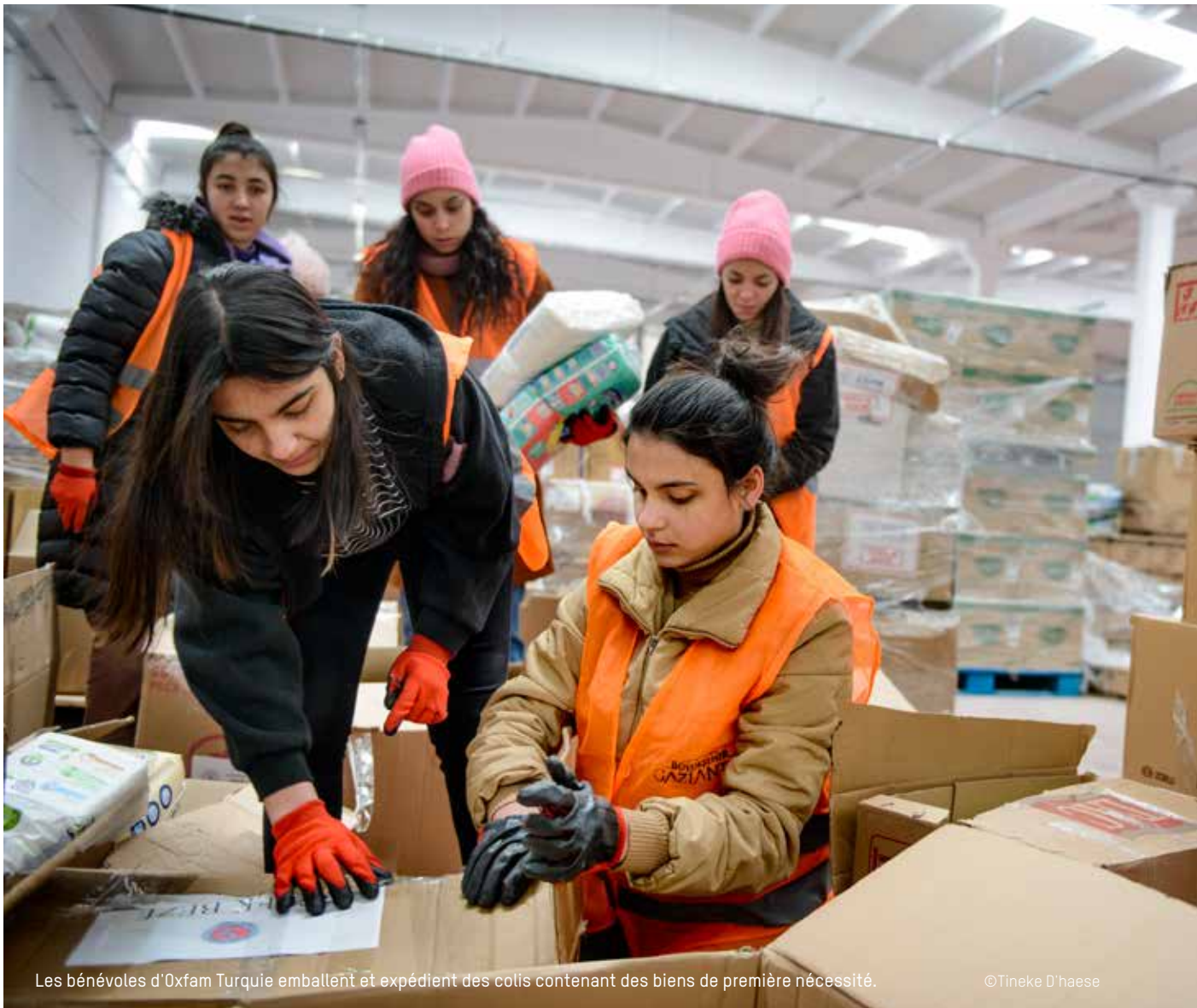
Les bénévoles d'Oxfam Turquie emballent et expédient des colis contenant des biens de première nécessité.