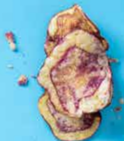
Chips de pommes de terre rouges BIO Pérou 100 g 3,85 €